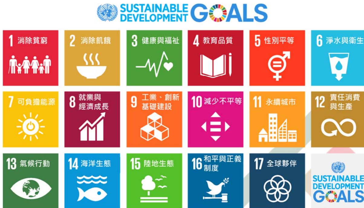
※ 此表由CSRone永續報告平台翻譯與製作